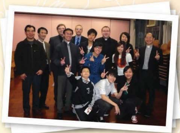
2010年與德國神父一起參與感恩祭