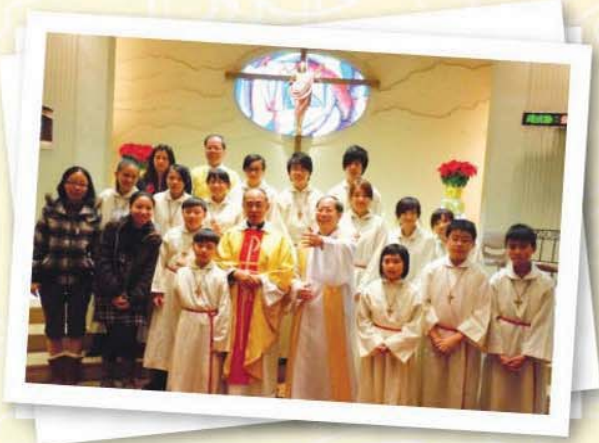
2010年度-陳副主教一起參與子夜彌撒