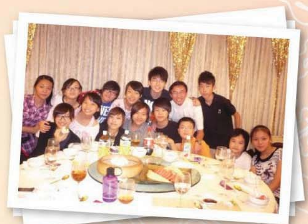
2010年度 - 主保聚餐