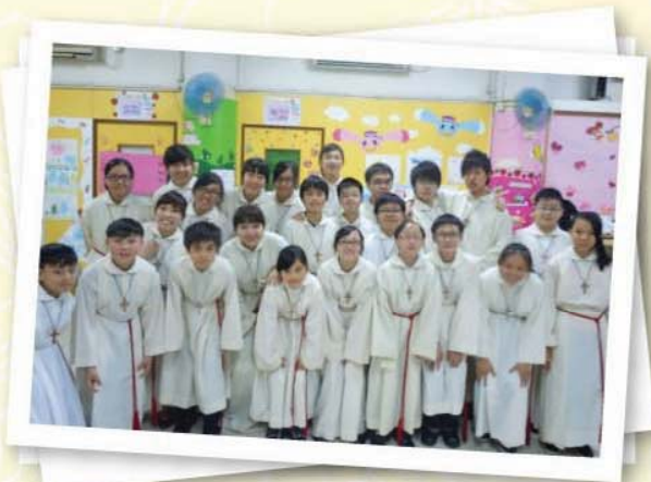
2011年度 - 復活節聖週6