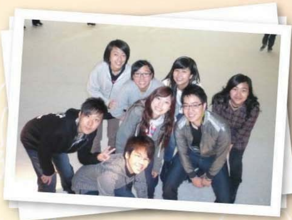
2009年度-輔祭會溜冰活動