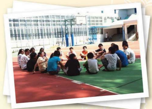
2011年度camp - 日光下的小遊戲時間