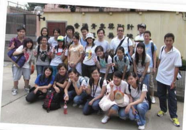
2008夏令營,充滿陽光與朝氣!