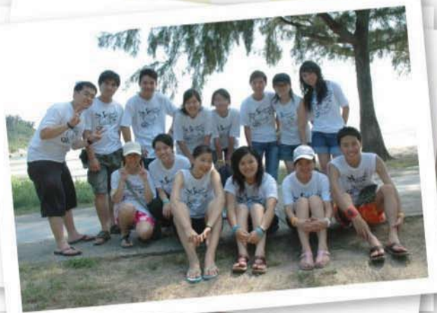
2007生態遊,一起來親親大自然吧!