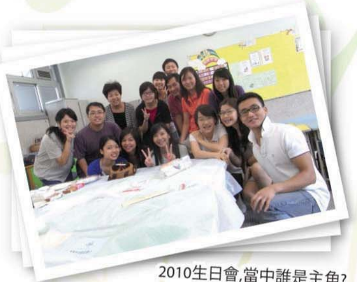
2010生日會,當中誰是主角?