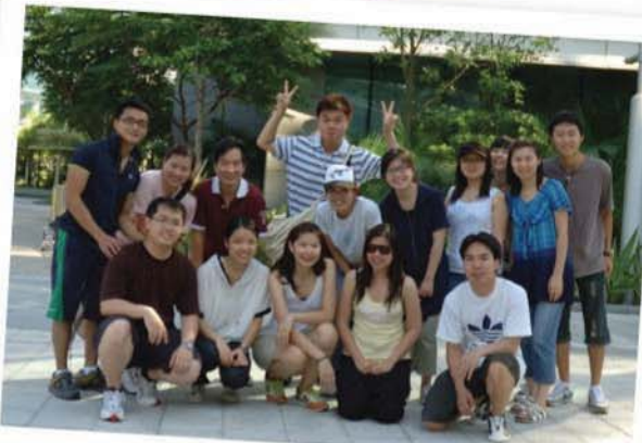
2010單車日,團員都展現出活潑的一面!