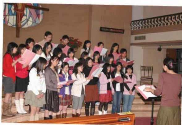
2006聖誕報佳音,齊來大合唱!