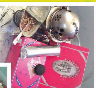
彌撒中的獻香用品，包括乳香、炭餅、吊爐、乳香灰(盛載乳香粒)