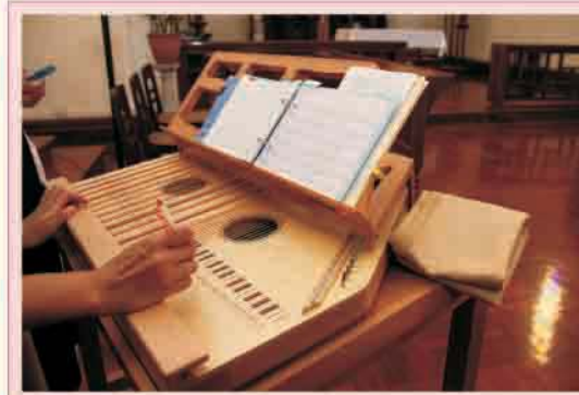
以裝先的持出位置便和。是圖預奏右手彈左的線美妙。外式只要彈右籤，律當弦奏音的國，定弦象旋適當奏的琴法飾設和着主在撥能奏的諧。

黃昏時候我們到了市中心的玫瑰聖母堂(板樟堂)參與提前彌撒。彌撒以葡語進行，雖然大家對葡語一竅不通，但有機會親身參與當地的彌撒，亦另一翻體驗。我們亦體會到天主令不同國家語言的人彼此以「Alleluia」去歌頌天主。