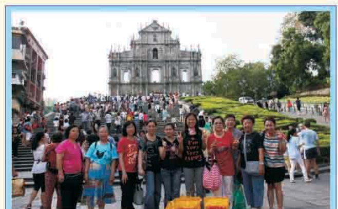
眾人於著名名勝聖保祿教堂的前壁遺跡(大三巴牌坊)留影！