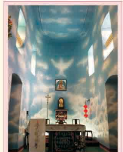
聖方濟各堂內的手繪壁畫聖神有如鴿子降臨，饒富特色。

雖然當日我們只到過三所聖堂，但是聖神的帶領下，我們都領受了不同的神恩。祝願大家都在生活上好好發揮這些神恩，結出常存的果實。