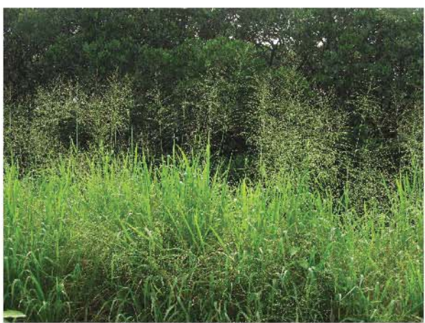
在「蘆葦叢」中生長的其他植物也包括類蘆 (濕地公園)