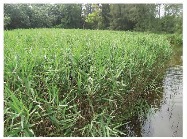
真正的蘆葦 Phragmites australis (濕地公園)