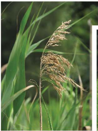
下垂的蘆著花穗/果穗

正式的蘆著 P. australis 雖然是全球其中一種出名的莠草（入侵性野草），但它卻用處多多，除了其根部是中藥（廿四味其中一味）之外，它的地面部份可以用來製造傳統的雨衣（蓑衣）、草鞋等，更可作覆蓋屋頂之用，其中空的著桿可以製成筆桿、魚桿或樂器，花和穗可製作掃帚和填塞寢頭。古時的猶太人還會用蘆著作為量度長度的工具（見默11:1,21:15-16）。