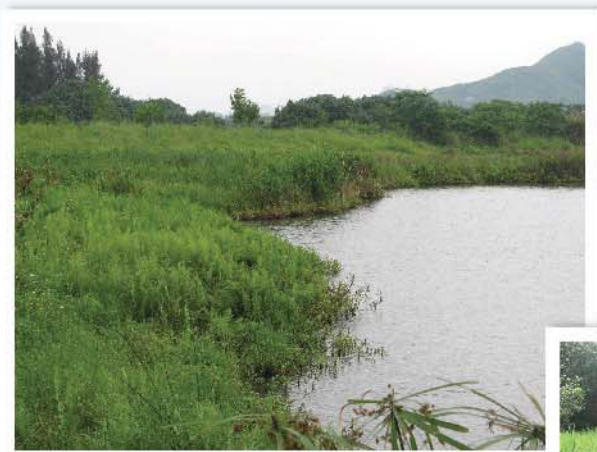
廣義的「蘆葦叢」包括多種水生草本植物 (濕地公園)

破傷的蘆葦，他不折斷；將熄的燈心，他不吹滅；他將忠實地傳佈真道。他不沮喪，也不失望，直到他在世上奠定了真道，因為海島都期待著他的教誨。（依42:3-4）