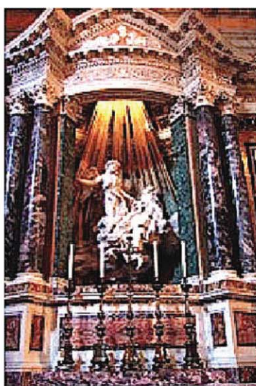
羅馬勝利之後聖母聖殿內 貝爾尼尼的作品