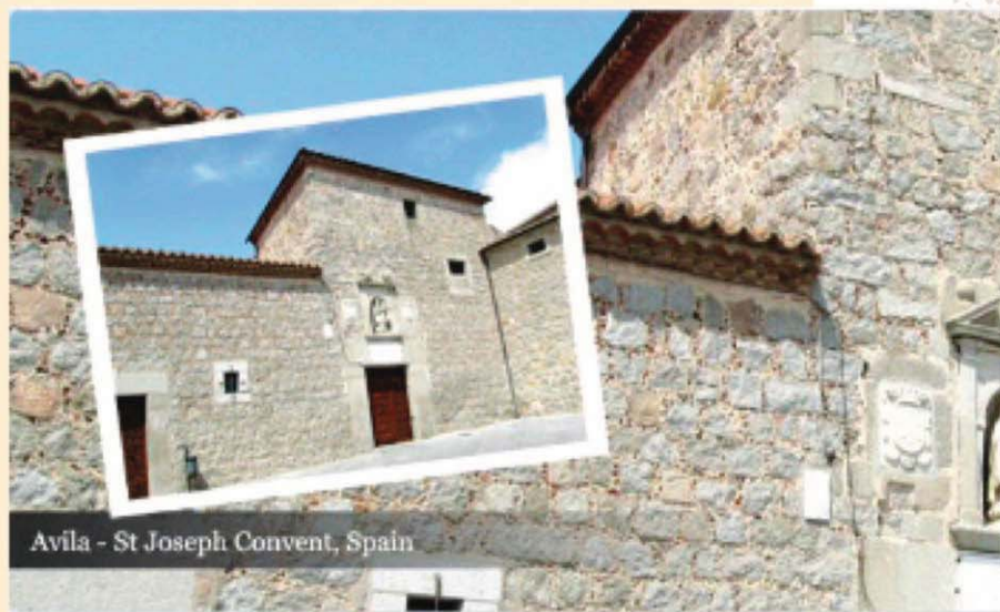
於1568年在亞味拉給聖若瑟的赤足加爾默羅男修院