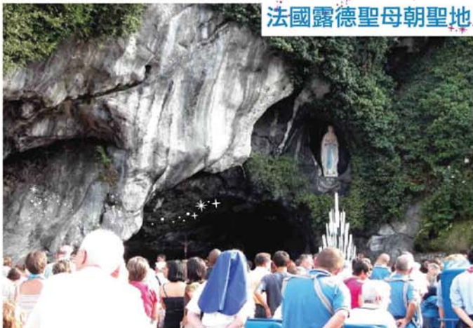
法國露德聖母朝聖地