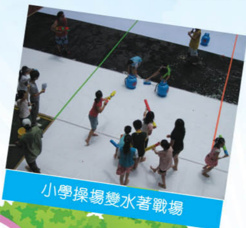
小學操場變水著戰場