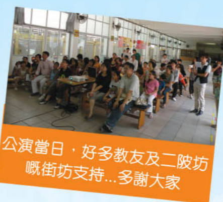
公演當日，好多教友及二陂坊嘅街坊支持...多謝大家