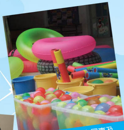
看...明愛社區中心同事及青音團成員，為水著歷奇活動整裝待發

時間一閃即逝，話咁快我加入青音團已經接近一年了。可能以往的暑假，我都沒有為自己編排活動，而因青音團的關係，所以今年七至八月，我過了一個從來也沒有經歷過的暑假，一次過接觸這麼多既新奇，又消耗體力的活動，十分好玩，希望來年暑期活動同樣好玩。