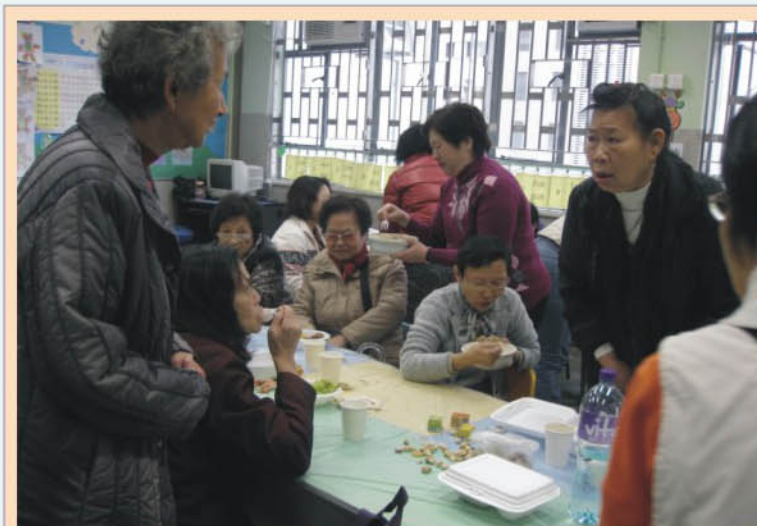
新春團拜，分享美食