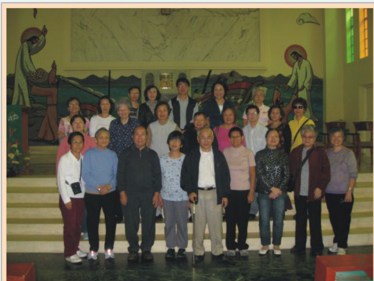
往香港仔聖伯多祿朝聖